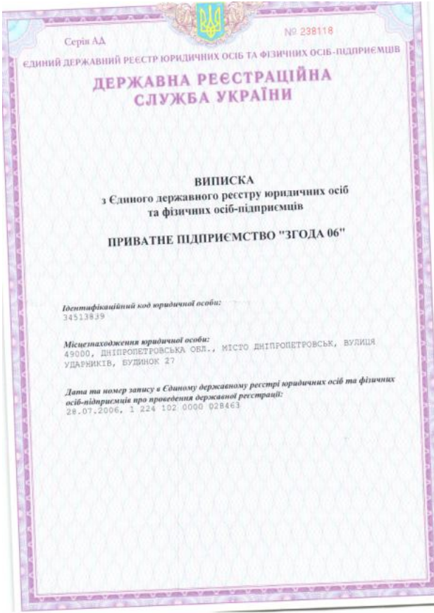
Фото документації Лоту №17