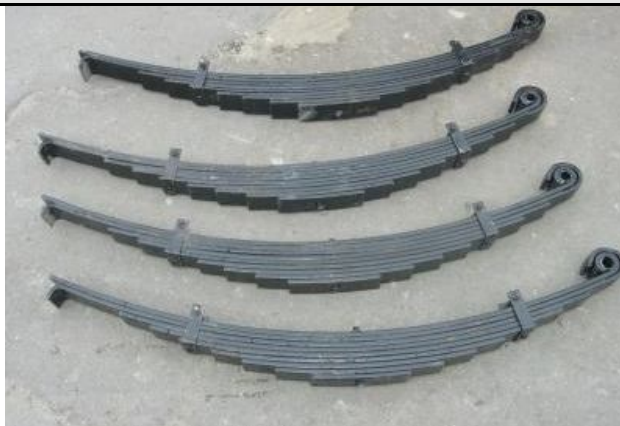
Фото Лот №05