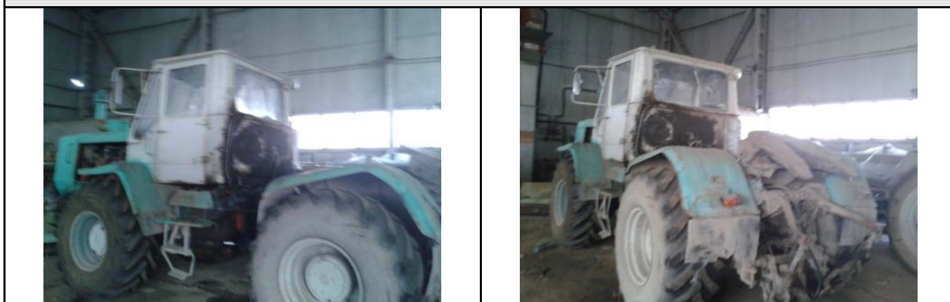
Фото Лот №11