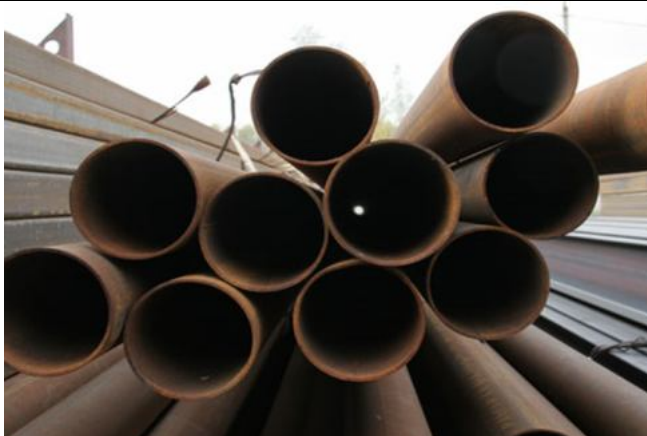
Фото Лот №06