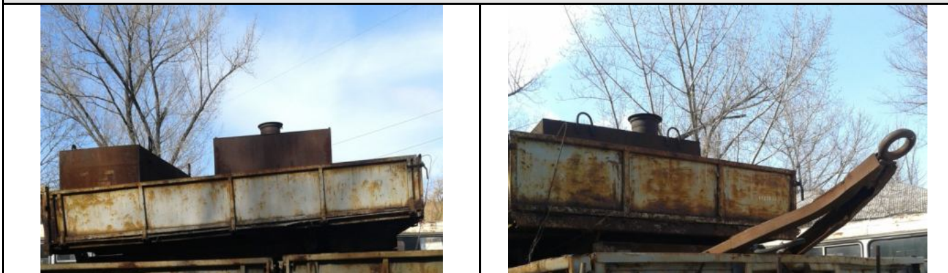
Фото Лот №09