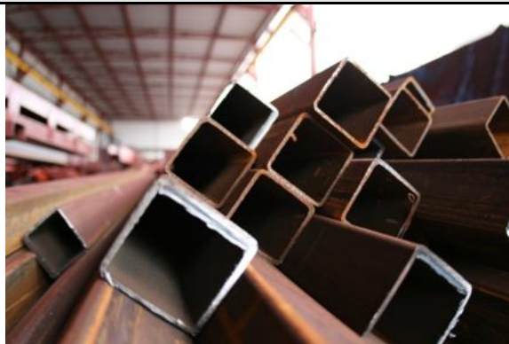
Фото Лот №03