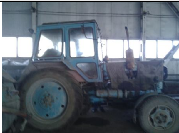
Фото Лот №04