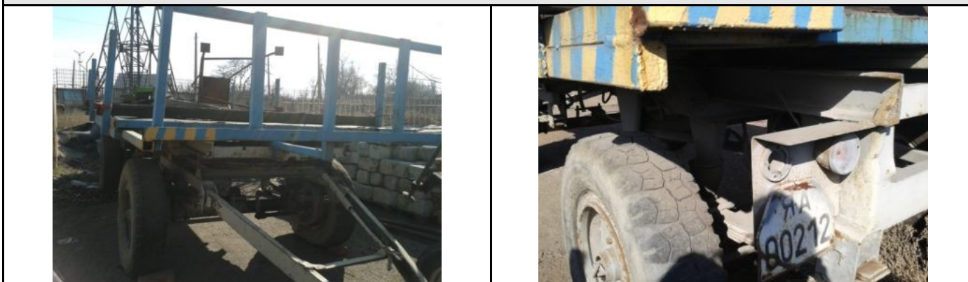
Фото Лот №07