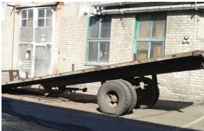
Фото Лот №10