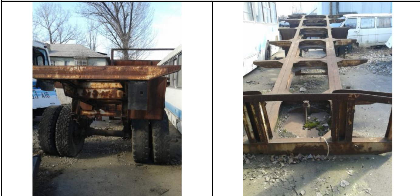
Фото Лот №08