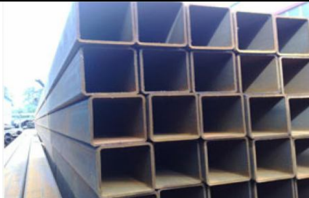
Фото Лот №02