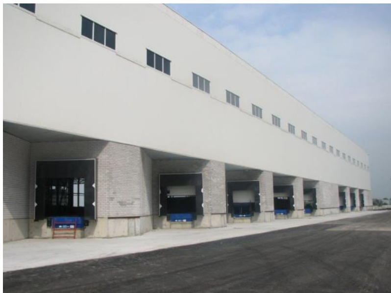
Фото лоту №15